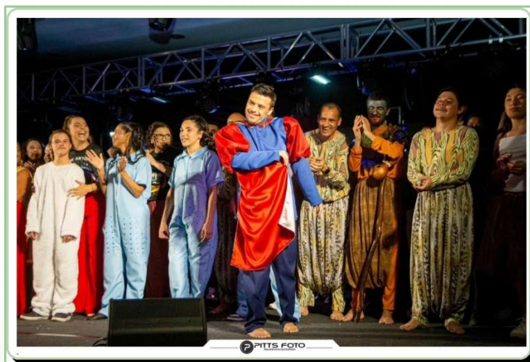
Figura 4 Show da Escola de Educação Básica São Judas Tadeu APAE de Jaguariaíva

As ações integram as diretrizes de responsabilidade socioambiental da organização e contribuem para o desenvolvimento sustentável das regiões onde a empresa atua, em conformidade com práticas de governança corporativa e compromissos relacionados à sustentabilidade.