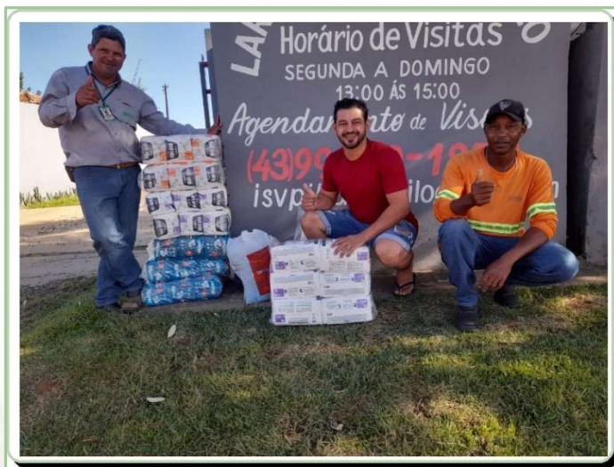
Figura 5 Doação de fraldas geriátricas em Ibaiti/PR

A doação de fraldas geriátricas, realizada por meio do Programa Resgate, contribui para o atendimento de necessidades básicas de pessoas em situação de vulnerabilidade social, especialmente idosos e famílias acompanhadas por instituições assistenciais da região.